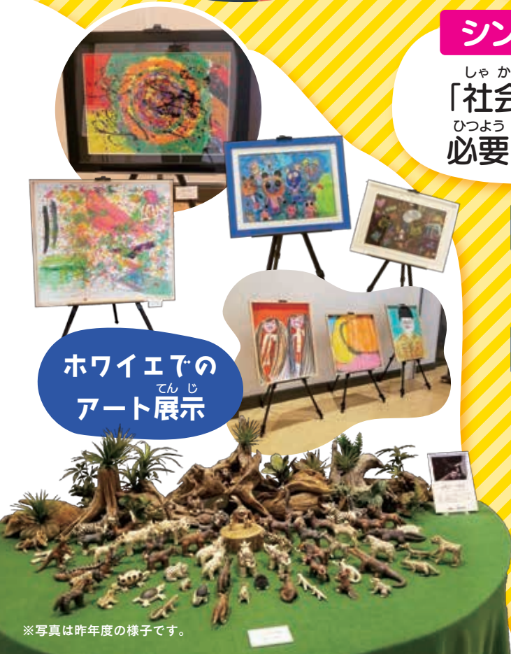
※写真は昨年度の様子です。